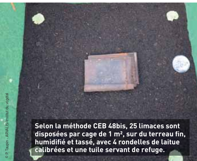
Selon la méthode CEB 48bis, 25 limaces sont disposées par cage de 1 m 2 , sur du terreau fin, humidifié et tassé, avec 4 rondelles de laitue calibrées et une tuile servant de refuge.

Pierre Taupin - p.taupin@arvalis.fr ARVALIS - Institut du végétal