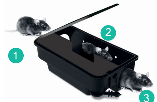
POSTE MINI RATS SOURIS

*Dans le cas des anticoagulants anti-vitamine K