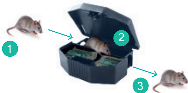
POSTE AEGIS® SOURIS